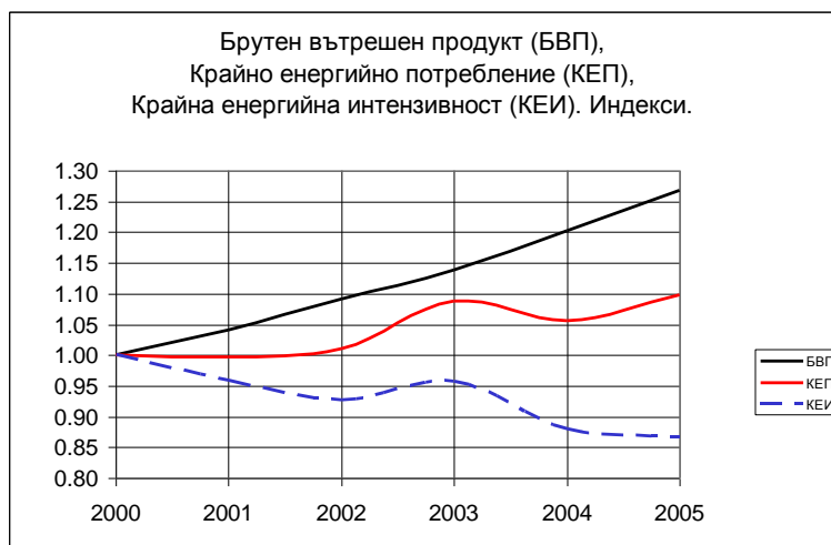
Фигура 2.2: Крайна енергийна интензивност – историческо развитие 4

Независимо от сравнително високата енергийната интензивност 1 на българската икономика и факта, че страната притежава значителен потенциал за реализация на икономически печеливши мерки по енергийна ефективност, след период на стабилизация крайното енергийно потребление 2 , а след него и първичното 3 започват да нарастват - фигура 2.2 и фигура 2.3.