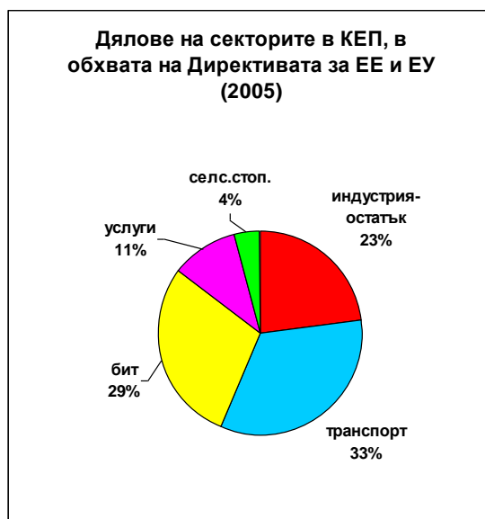
Фигура 2.5: Структура на крайното енергийно потребление в обхвата на Директивата (разпределение по сектори)

На фигура 2.5. е показано потреблението по сектори за 2005 година. За разлика от разпределението на общото крайно енергийно потребление, в което най-голям консуматор е индустрията (39%), тук в крайното енергийно потребление, в обхвата на Директивата, се вижда, че 62% от енергийното потребление е съсредоточено в секторите „Транспорт” и „Домакинства” .